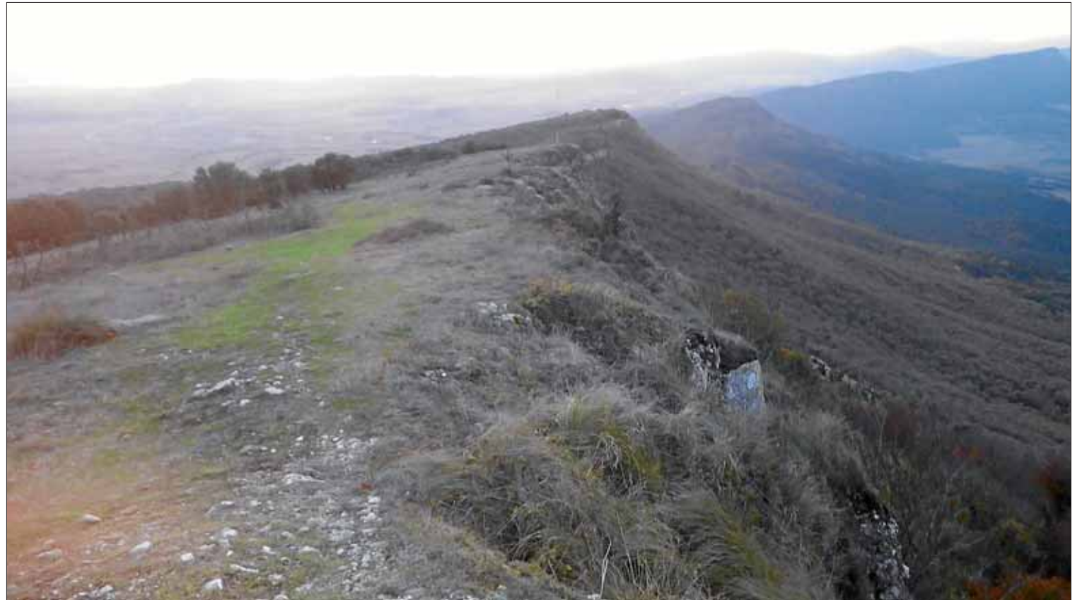
El recorrido por el filo de dos vertientes nos permite disfrutar de vistas espectaculares.

Aquí giraremos a la izquierda, dirección este por todo el cordal, para llegar al gran monte Zaldiaran (978 m). Volveremos